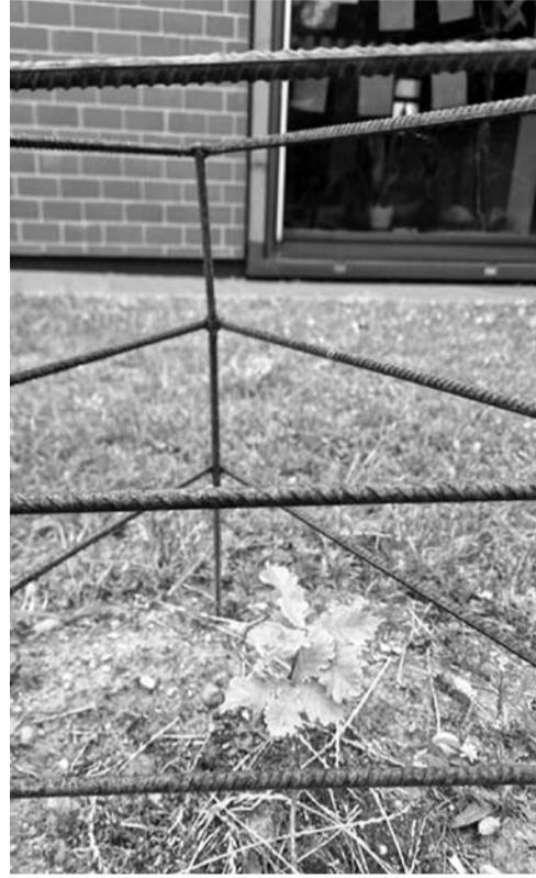
Iš Stelmužės ąžuolo gilės išaugintas ąžuoliukas, skirtas jaunimo metams paminėti, aptvertas armatūros tvora.