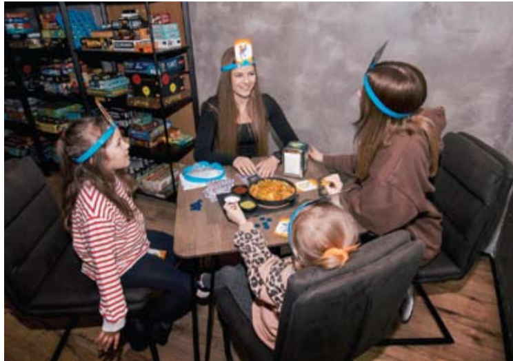
Į barą-klubą „Industrija“ renkasi ne tik jaunimas – užsuka ir šeimos, senjorai.